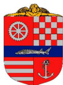
XIII. Kerületi Önkormányzat